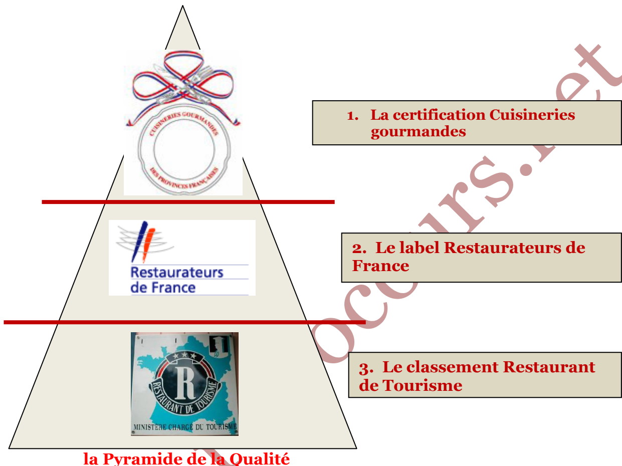
la Pyramide de la Qualité

En matière de restaurants, la seule classification officielle reconnue par le secrétariat d'Etat au tourisme est la Pyramide de la Qualité , venue remplacer en 1999 le classement en étoiles de 1963. Créée en vue de revaloriser l'image de la profession, et d'offrir aux consommateurs et aux touristes une meilleure lisibilité de l'offre de restauration, la Pyramide de la Qualité repose sur des impératifs de qualité et de professionnalisme. On peut distinguer 3 paliers.