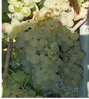
Rolle (ou Vermentino blanc)