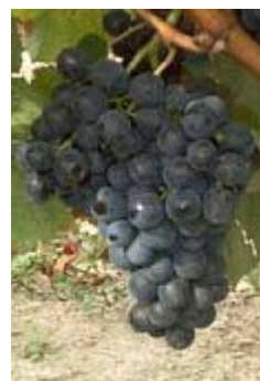
Auxerrois ou Malbec ou Cot